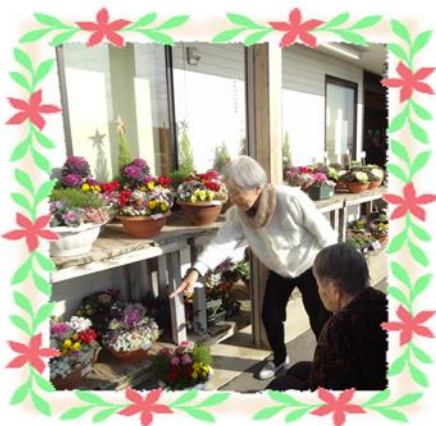
道の駅風和里へドライブ