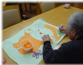
みきゃんのちぎり絵